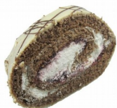
Zamatová roláda (60g)